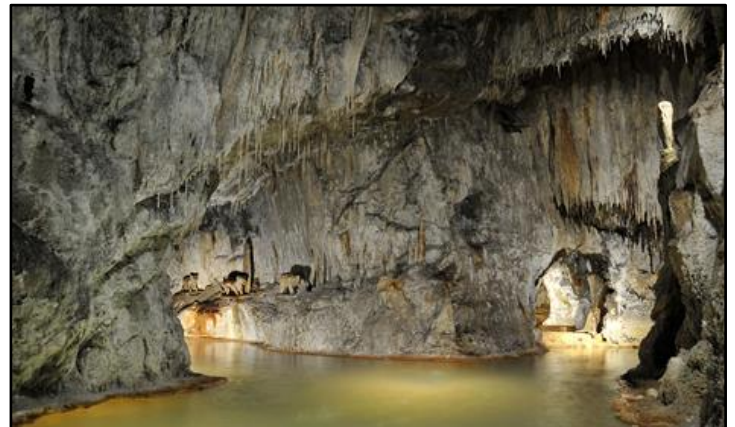
Les Fontaines Pétrifiantes de Saint-Nectaire