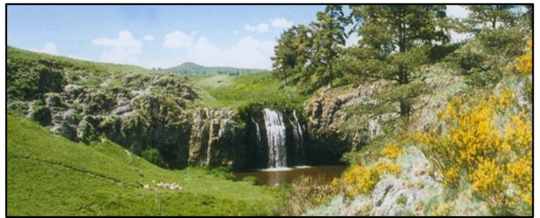
La cascade des Veyrines

Matinée Murol + Saint-Nectaire (environ 85km)