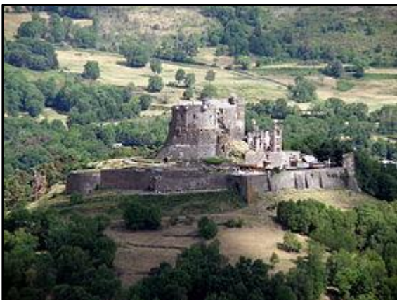
Le château de Murol